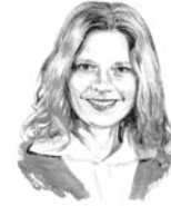
VON VERA PINK